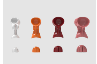
Kits de exprimido

Los kits de exprimido de diferentes tamaños permiten maximizar el rendimiento de la fruta exprimida en función de su diámetro. Fácilmente identificables gracias al color característico de cada rango: Pequeño (S): Gris; Mediano (M): Naranja; Large (L): Granate; Extra-grande (XL): Rosa.