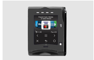
Sistema de pago

Zummo lanza su línea de exprimidores con sistema de pago cashless incorporado para disfrutar de un zumo recién exprimido en cualquier momento y en cualquier lugar.