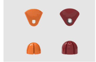
Kits de exprimido

Mediano (M): Naranja; Grande (L): Granate;