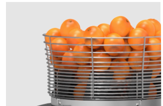
Cesta en dos tamaños

La máquina incluye de serie una cesta de 16 kg de capacidad con tapa que impide el acceso a las naranjas. En los casos en los que se necesite una autonomía menor, existe una cesta opcional que tiene una capacidad de carga de 16 kg de fruta.